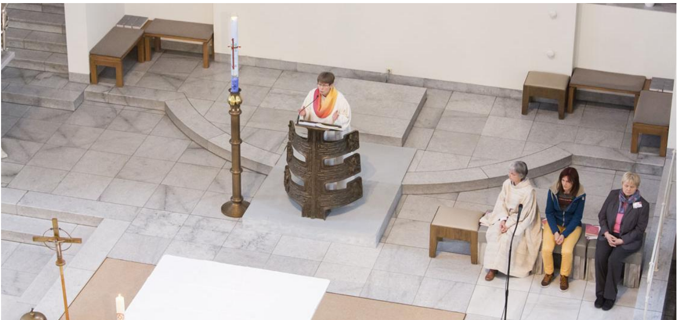
Kirche zukunftsfähig gestalten - Frauen mehr Verantwortung in der Kirche geben.

Frauen in der Kirche hatten bisher einen langen Atem und große Geduld. Nun ist es höchste Zeit, konsequente Schritte zu gehen, damit Partnerschaftlichkeit und Gleichberechtigung von Frauen und Männern in der Kirche Wirklichkeit wird."