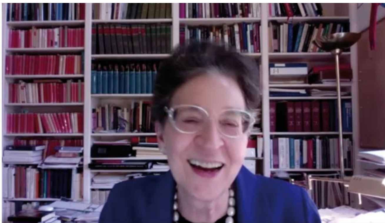
Bernadette Brooten während des Junia-Interviews im Spätsommer 2020.

Die amerikanische Theologin Bernadette J. Brooten gilt als Entdeckerin der Junia. Und das bereits in den 1970er Jahren.