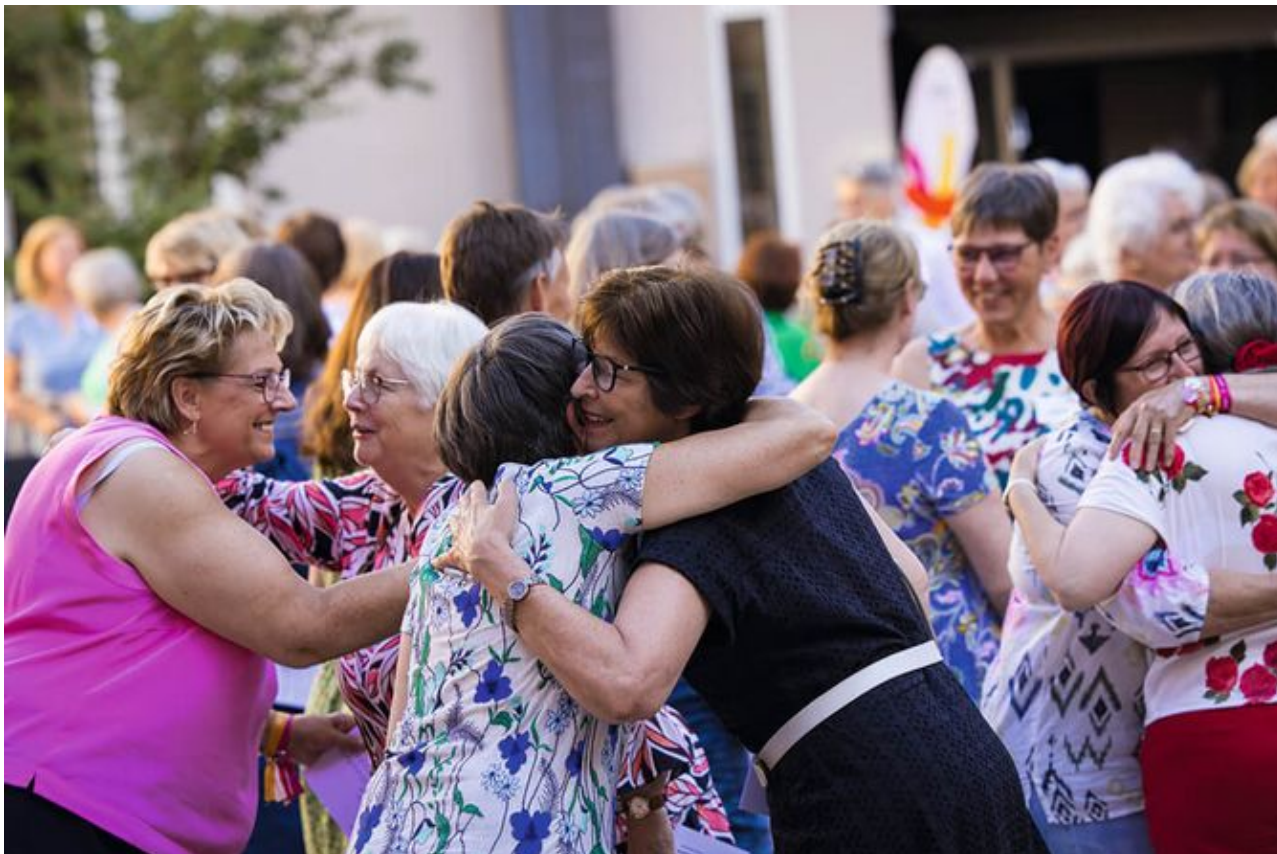
Die kfd - eine Gemeinschaft, die trägt.

Gesellschaft und setzen uns für ihre Rechte ein.